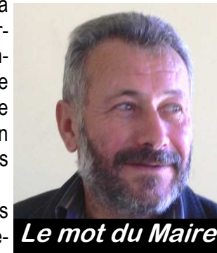
Le mot du Maire