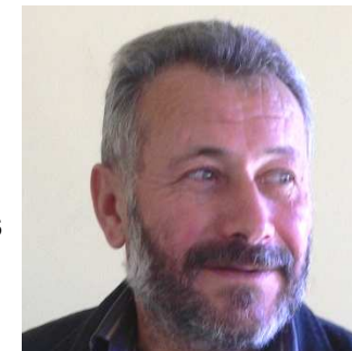
Le mot du Maire

Je voudrais une nouvelle fois les féliciter et les remercier pour le travail qu'elles accomplissent.