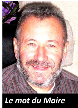
Le mot du Maire