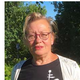
Florence Proud'hon Hébergement Touristique Représentations : SICTOM - SDE - CCAS - Centre social