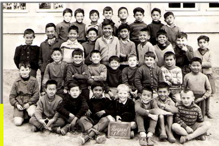
Photo de classe 1958-1959

ouverture du musée pour les 70 ans de l'arrivée des rapatriés d'Indochine à Noyant.